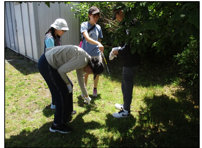
小さいごみを見つけてトングで拾いました。

八王子市ごみ総合相談センターによる「はちおうじ出前講座（ごみの減量とリサイクル）」では、八王子市のごみがどのように集められてリサイクルされているのかを生徒達は興味津々で話を聞いていました。