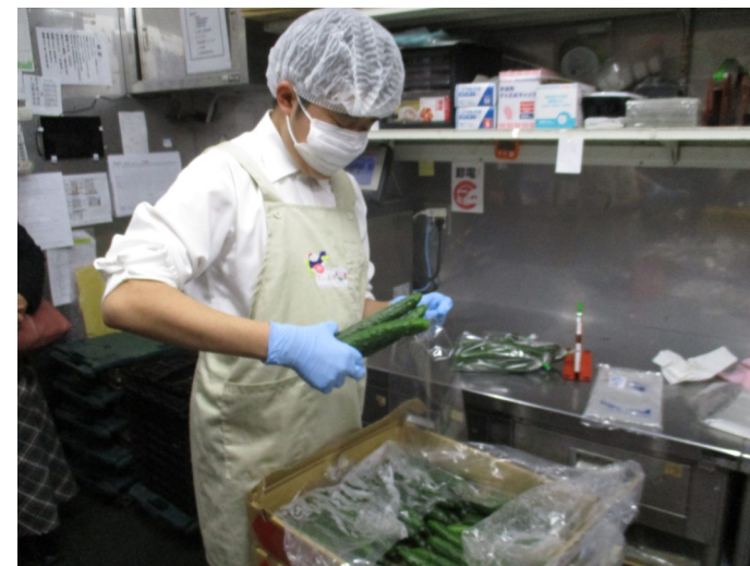
袋詰め作業。向きを確認して入れています。

職場の方々に緊張しながら挨拶し、仕事内容を教わり真剣な表情で黙々と集中して取り組みました。二日目の体験が終わると充実した表情や安堵の笑顔が見られ、学校ではできない貴重な体験を経験できた様子でした。