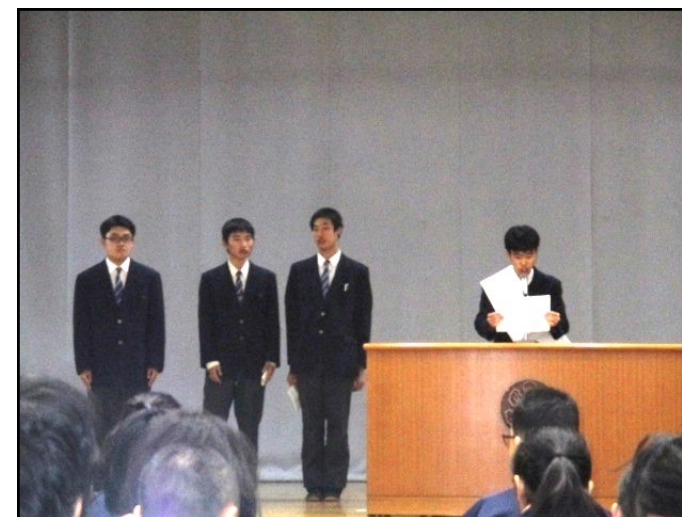
演説会で立候補者は自分の熱い思いを述べました。

これらの活動を通して、選挙への理解を深め、主権者の意識を高めることができました。