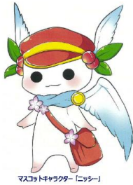
マスコットキャラクター「ニッシー」

東京都立小平特別支援学校 住所:小平市小川西町二丁目33番1号 ※西武新宿線(拝島線) 西武国分寺線「小川駅」徒歩7分 販売・展示・体験部門 11:00~15:00 ステージ活動発表部門 10:30~15:00